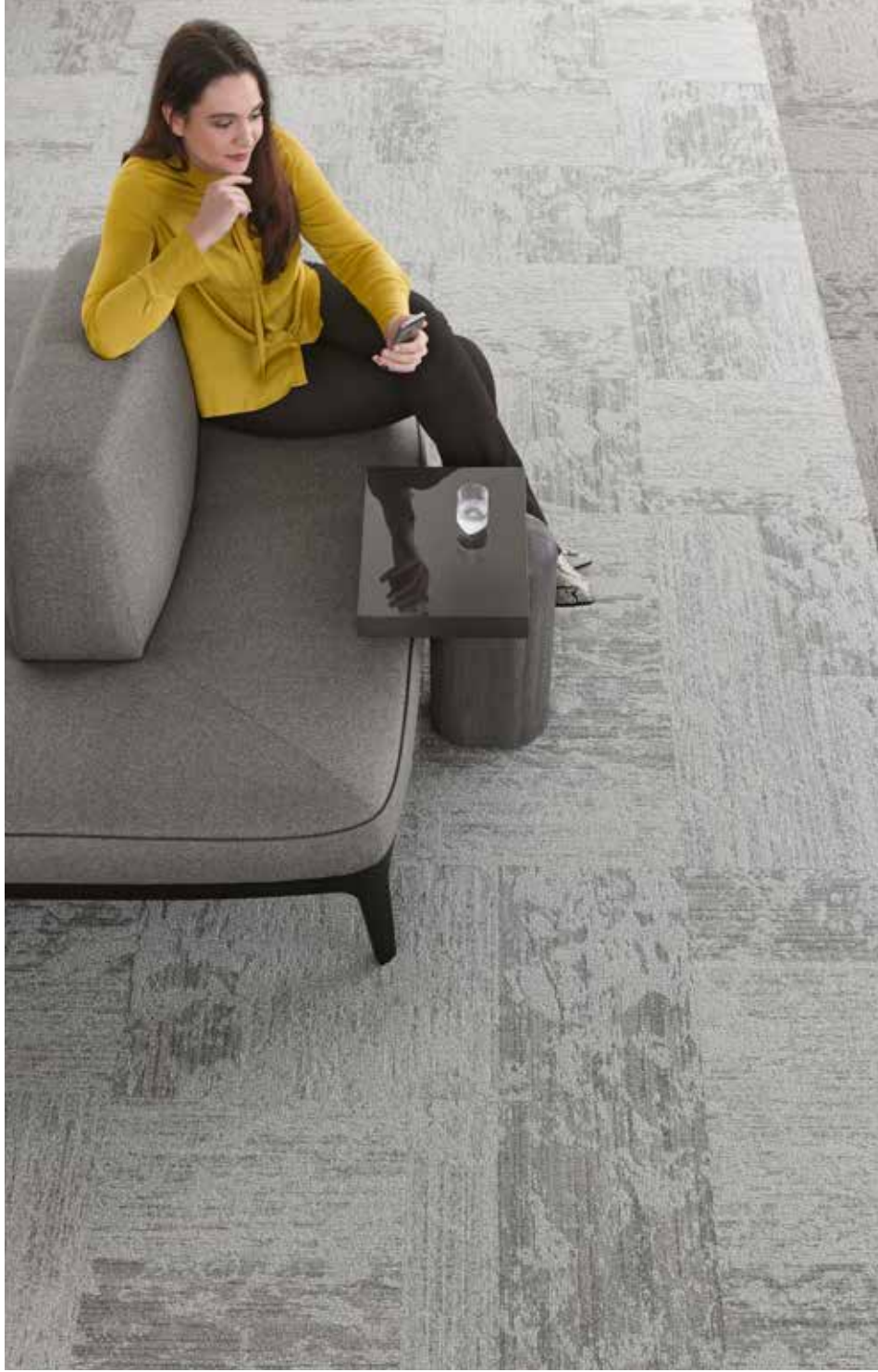
Breccia 9523, 9066