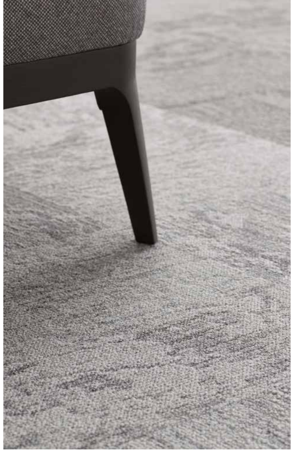
Breccia 9523, 9066